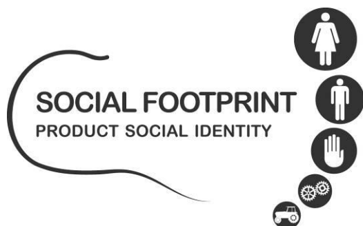
Figura 1: Marchio "Social Footprint – Product Social Identity"

Social Footprint – Product Social Identity è un marchio registrato e per il suo utilizzo, l'Organizzazione deve essere in possesso di un certificato "Social Footprint – Product Social Identity" valido.