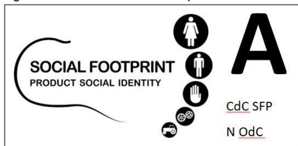
Figura 2 : Etichetta "Social Footprint – Product Social Identity" livello base "A"